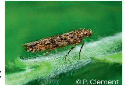
ზრდასრული T. absoluta

ტოვებს ჩაღრმავებულ ადგილებს ფოთლებზე, ღეროებსა და ნაყოფზე. დაზიანებულ ადგილებზე შესაძლოა, განვითარდეს ნეკროზი.